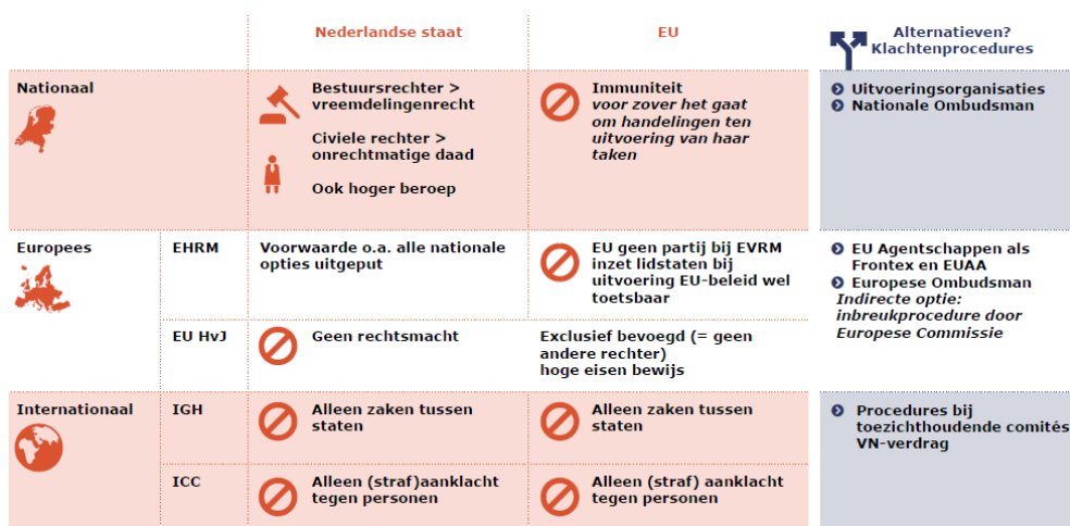
Figuur 2 Effectieve rechtsbescherming: toegang tot de rechter

Er zijn een aantal mogelijkheden voor slachtoffers om bij nationale en Europese rechters een staat aan te spreken.